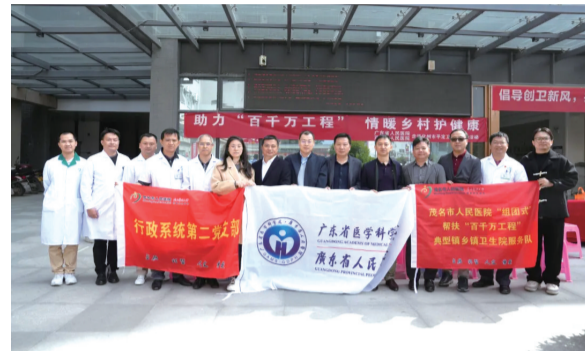
茂名市人民医院“科普进社区”义诊活动现场