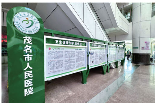
健康科普教育基地核心区域实景

茂名市人民医院凭借扎实的科普基础、创新的传播模式与显著的社会成效,荣获广东省科学技术协会、广东省科学技术厅联合授予的“广东省科普教育基地(2025—2029年)”称号!这是继医院获评“广东省高水平医院重点建设医院”“国家三级甲等医院”后,在健康促进与科普领域斩获的又一省级权威认证,标志着医院在粤西地区健康科普工作中的引领地位得到官方认可,为“健康茂名”建设注入强劲动力。