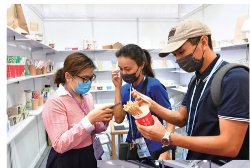
▼韩国采购商在小电器展台选购产品。

各界反响热烈，认为论坛的举办是一项新的创举，丰富了广交会的功能和内涵，对于更好发挥广交会畅通国际贸易要素流动的载体作用、创新发展的带动作用和服务双循环的桥梁作用具有积极意义。