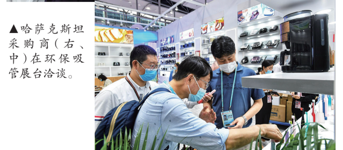
▲哈萨克斯坦采购商(右、中)在环保吸管展台洽谈。