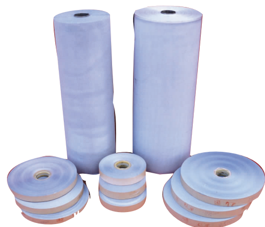
产品名称:铝电解电容器用电极箔,化成箔是国家鼓励和支持发展的新型电子功能材料