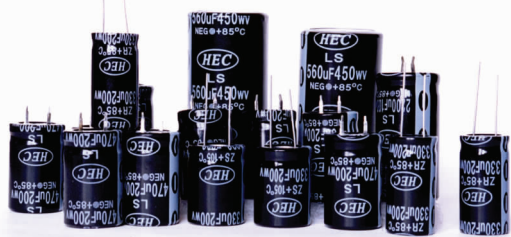
产品名称:铝电解电容器

放眼未来,公司将始终坚持合力共赢、勇于创新、与时俱进的企业精神,坚定信念,披荆斩棘,站在发展全局的战略高度,对公司的发展精准把脉,有效提升发展速度、发展质量和水平,创造新的篇章,以骄人的业绩回馈社会。