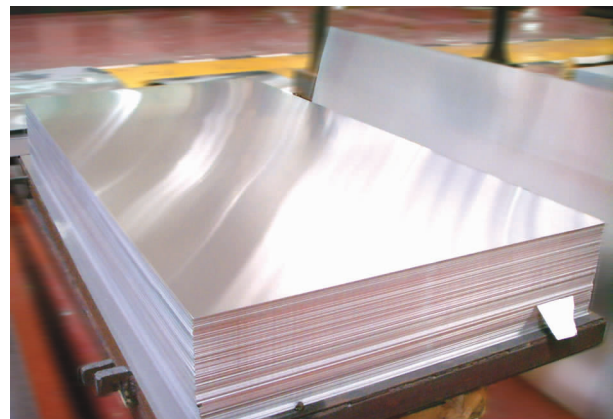
产品名称:电子铝箔;是铝加工行业的高附加值、高技术含量产品,铝电解电容器生产用化成箔的上游产品