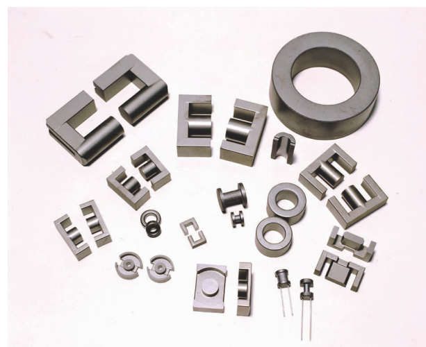
产品名称:镍锌软磁铁氧体材料,应用于功率电感,共模电感等